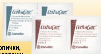
Кърпички, създаващи защитен слой PBW